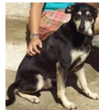
Tico - 5 anos

"O mundo não está ameaçado pelas pessoas más, mas sim por aquelas que permitem a maldade". Albert Einstein -